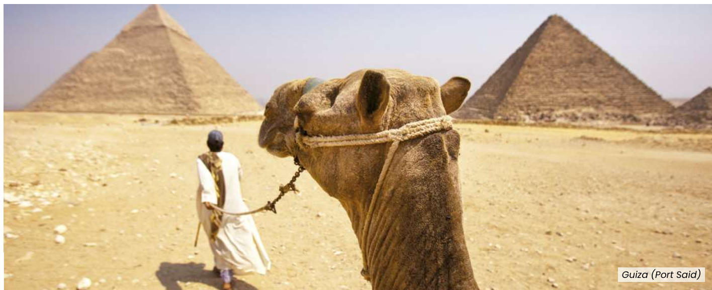
Guiza (Port Said)

Precios Todo Incluido a partir de 2.159€ por persona*